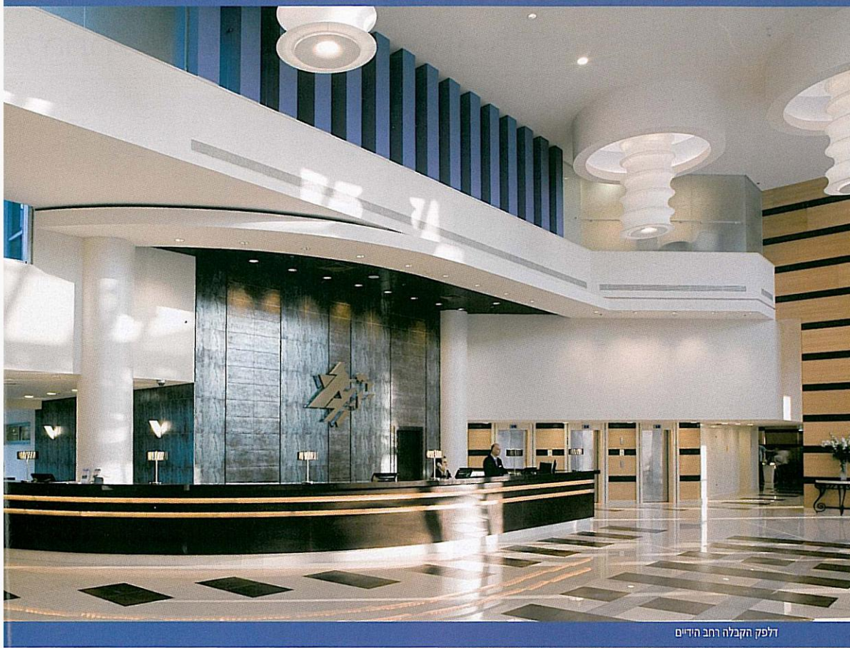
דלפק הקבלה ורחב הידיים

מלון כפר המכביה המחודש פתח לאחרונה את אגף הסוויטות החדש היוקרתי, ומשדר תחושה של אלגנטיות לצד נוחות ביתית