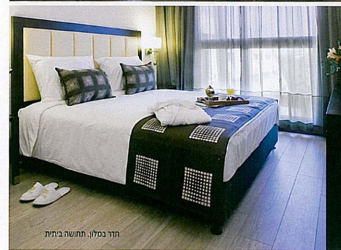
חדר במלון. תחושה ביתית

חדרי המלון תוכננו בסגנון שנע בין הקלאסי והמודרני. הנחת היסוד בעבודתה של אדריכלית הפנים, הייתה ללכת על צבעים שונים ומיוחדים, ואפשר לומר אף חריגים בנוף המלונות בארץ. זאת, על מנת לבדל את לובי המלון במתי המלון האחרים, שם הצבעים בדרך כלל רציניים למדי. "בחרתי בצבעים המשקפים אלגנטיות וייחודיות כגון סגול, פוקסיה (רוד-סגול), שנהב וכדומה. צבעים אלה, מכיוון שאינם סטנדרטים, גורמים לתדהמה ראשונית אצל המבקר, וגם משרים קרירות ורעננות בארצנו החמה. ההשראה שלי באה גם מהצבעוניות של בגדי הספורטאים, וברור לנו שכפר המכביה צמח ממה שמשרד תחום הספורט. בחרתי לא להשתמש בצבעים של צהוב ואדום, על מנת לא ליחס עדיפות לאחת מקבוצות הספורט בארץ". אך מעבר לצבע, הלווי האלגנטי נקרה בדרכו של כל מי שנכנס פנימה, וקשה שלא לשים לב למאפייניו: מבואת כניסה גבוהה ומרשימה, המשקיפה על המלון כולו, ריהוט עכשווי לצד הרבה עץ שמחמם את המקום. ויחד עם כל אלו – גם רעננות צבעונית.